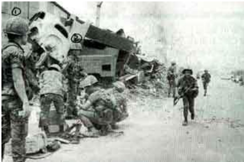
Mậu Thân - Trinh sát Liên Đoàn 5 BĐQ