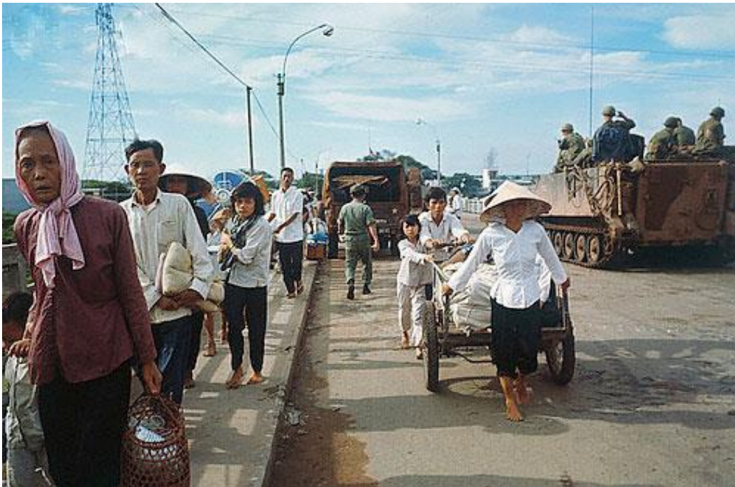
Dân chúng chạy loạn trên cầu chữ Y, Sài Gòn, trong trận Mậu Thân 1968.

Có lẽ không ai trong chúng ta quên được những bất ngờ đầy kinh hoàng của Tết Mậu Thân 40 năm về trước.