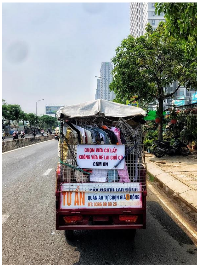
Xe quần áo 0 đồng của người Sài Gòn