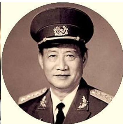
Hoàng Văn Thái