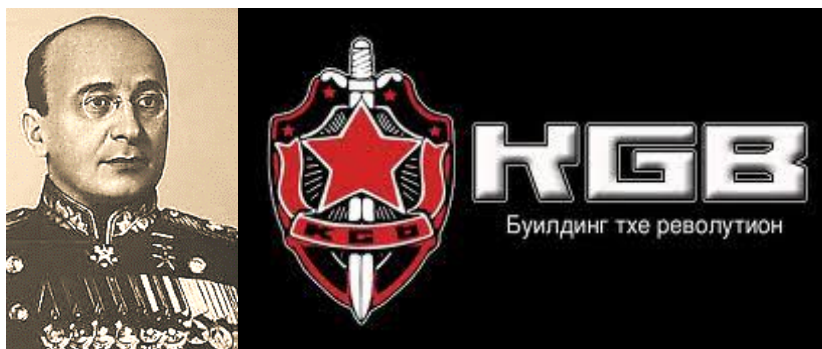
Lavrentiy Pavlovich Beria

Lavrentiy Pavlovich Beria (29-3-1899 – 23-12-1953) là đại tướng 4 sao, trùm mật vụ KGB, tên đồ tể thi hành những vụ bắt bớ giam cầm, ám sát và thủ tiêu những đối thủ chính trị của Stalin.