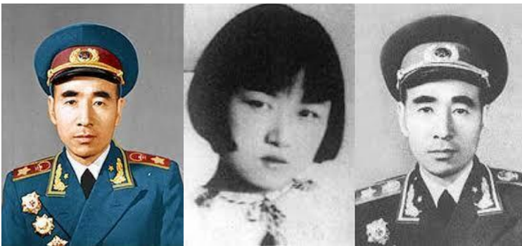
Lâm Bru và vợ

Lâm Bru là thuộc cấp của Bành Đức Hoài, lừa thầy phản bạn, được Mao cho Lâm Bru thay thế BDH ở chức vụ Bộ trưởng Quốc Phòng, rồi làm Phó chủ tịch đảng, là nhân vật số hai, và được chọn làm người kế vị Mao. Lâm Bru là “Kiến trúc sư” của cuộc Cách mạng Văn hóa.