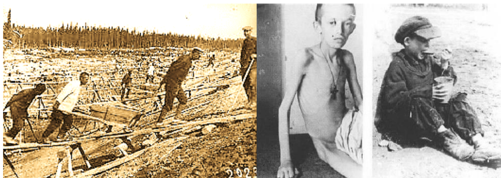
Trại lao động khổ sai Gulag

Hai năm 1936, 1937 là thời gian kinh hoàng nhất đã bao trùm trên Liên Xô, gọi là “Nỗi khiếp sợ vĩ đại”.