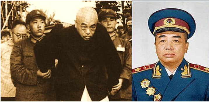
Bành Đức Hoài

Bành Đức Hoài cũng vậy, bị giam cho đến chết trong tù năm 1976. Số của Bành Đức Hoài (BDH) rất bi đát. Bị quản chế ở vùng núi Tứ Xuyên năm 1957. Năm 1961 được cho về thăm quê nhà ở Hồ Nam. Năm 1966, Mao sai một viên tướng đi giải BDH về Bắc Kinh. Viên tướng cảm phục và xin tha tội cho Bành, thì bị Mao bỏ tù luôn.