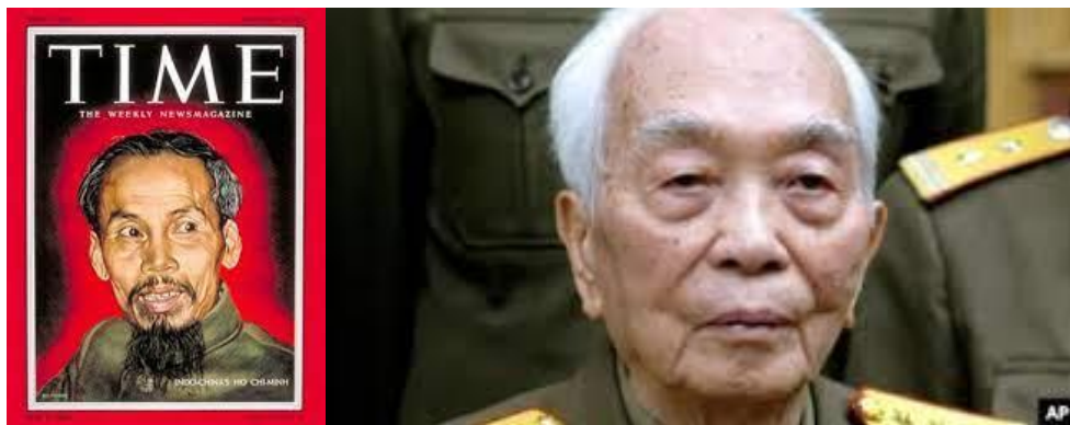
Hồ Chí Minh và Võ Nguyên Giáp