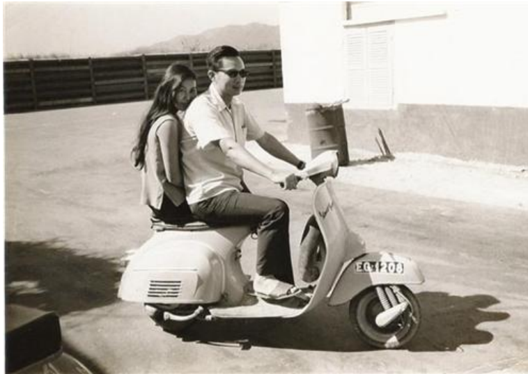
Vespa Sài Gòn (thập niên 1960)

Ngoài hai thứ đó ra, con gái cũng đi dạo phố. Con trai đi dạo phố là để ngắm. Con gái đi dạo phố xuất hiện như một trình diễn, ăn diện, mát, kiểu để được nhìn, để được thừa nhận, để nhận phần lớn là những lời tán tỉnh, khen tặng.