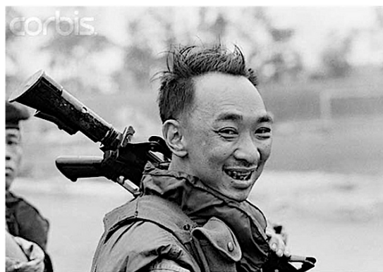
General Nguyen Ngoc Loan