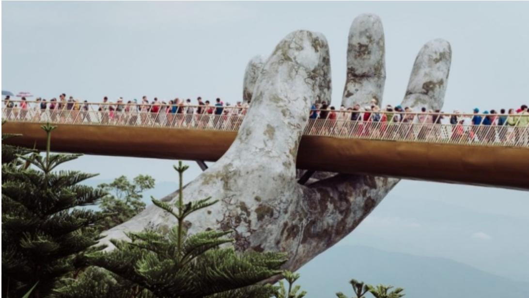
Cầu Kiêu Bridge