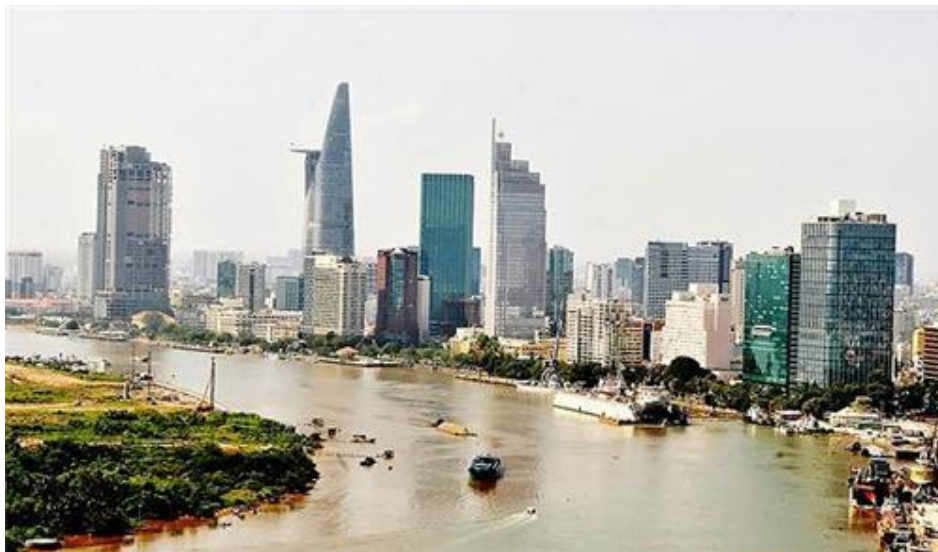
Cao ốc và nhà đất

Tôi hoàn toàn không nhận ra những con đường từ sân bay Tân Sơn Nhất về trung tâm thành phố.