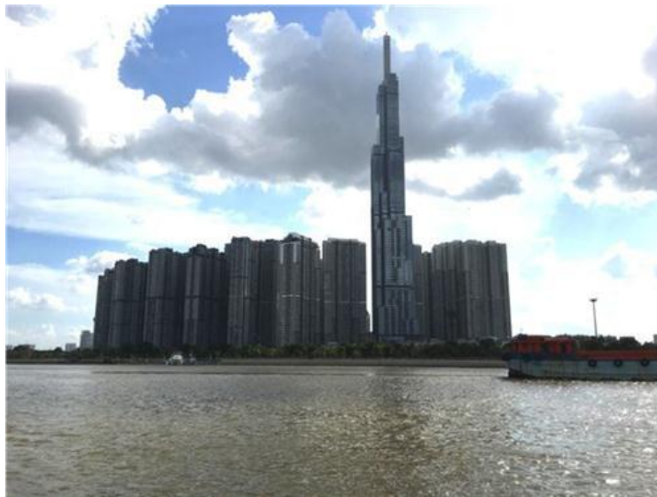
Khu cao ốc Vinhomes và toà nhà 81 tầng nhìn từ sông Sài Gòn

Ngoài những cao ốc và nạn kẹt xe, điều thứ hai làm cho tôi có ấn tượng là nhãn hiệu VIN ở khắp mọi nơi. Mọi khu phố đều có những cửa hàng tạp hóa Vinmart, rải rác đây đó bảng quảng cáo cho xe hơi Vinfast, ngự trị tại trung tâm thành phố là một cao ốc bán đồ đắt tiền tên là Vincome, dọc bờ sông Sài Gòn là các cao ốc Vinhomes sừng sững, với trung tâm là một tòa nhà, nghe nói cao nhất nước, 81 tầng, mà đi đâu ở Sài Gòn người ta cũng có thể nhìn thấy nó.