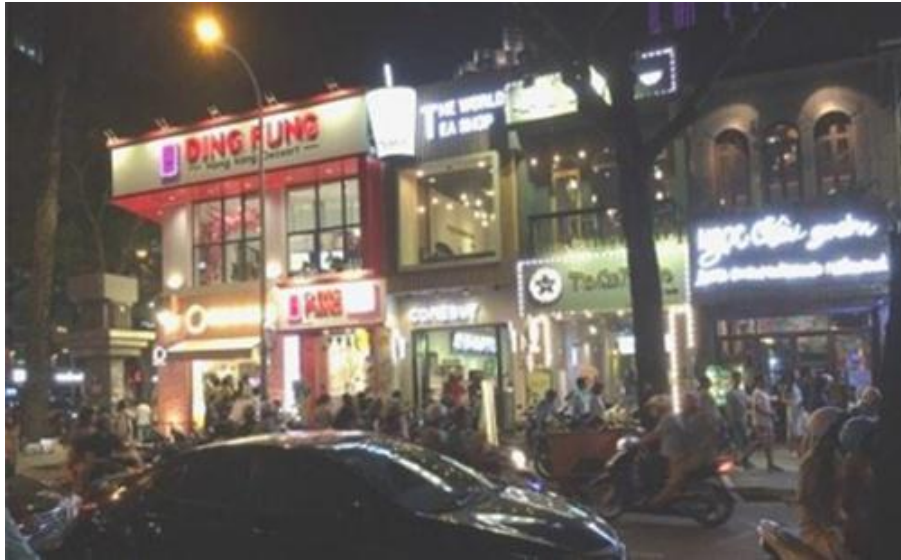
Các quán kem và cà phê buổi tối trung tâm quận nhất Sài Gòn

Tôi tìm tới một con hẻm trên đường Phạm Ngọc Thạch (trước kia là Duy Tân) vẫn còn một dãy ghế thấp của một hàng cà phê cóc, ngồi đây mà nhớ cái yên tĩnh trước kia, vì bây giờ thì 24/7 không ngớt xe cộ, lúc nào cũng kẹt.