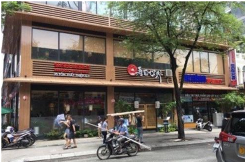
Các quán ăn Nhật và Hàn trên đường Tôn Thất Thiệp

Giá một ngôi nhà liên kế (town house bên Mỹ) 3 tầng lầu, trong một khu mới mở như vậy vào khoảng 5 tỉ đồng, tức khoảng 200 ngàn đôla Mỹ, mà xung quanh không có gì cả, từ cống rãnh cho đến vỉa hè.