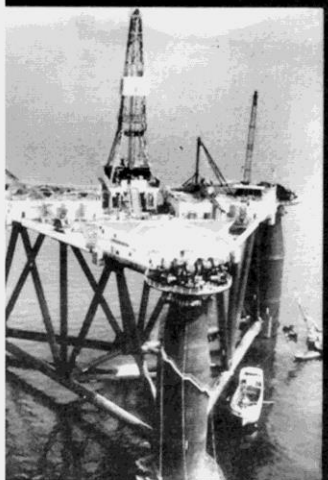
Không lồ do một công ty Nhật-Bản chế tạo mỏ dầu dưới biển gần Melbourne.