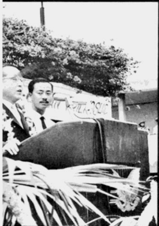
Ông Đại-Hàn (trái) viếng thăm Việt-Nam và hồi trung tuần tháng 2-1967 được ông Nguyễn Cao Kỳ tiếp tại phi trường.