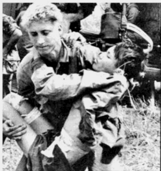
Y tá Mỹ cứu trợ một Việt Cộng bị thương ở Plei-Me, y được đưa tới quân y viện để điều trị.